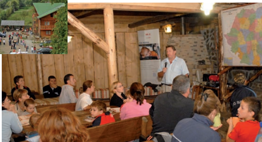
Asociația s-a întrunit deja în a treia sedință (Septembrie 2008 la Cabana Nora)