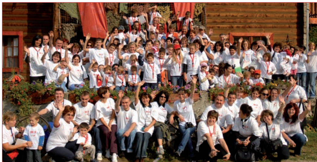
O parte din „marea familie” - septembrie 2008 la Cabana Nora, Valea Sadului