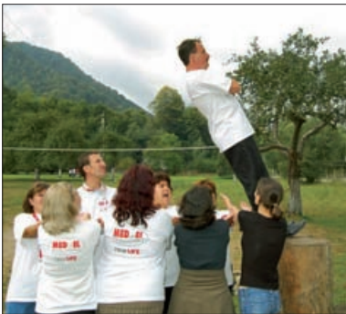
Gata? Gata, Gata? Activități Ice-Break pentru părinți

Părinții au participat la mai multe sesiuni de comunicări, susținute de specialiști, pe diverse teme cum ar fi: drepturile și nevoile copilului, abordarea în echipă a problematicii familiei copilului deficient de auz, importanța intervenției timpurii în formarea competențelor de comunicare. Prin aceste activități părinții au fost familiarizați cu cele mai noi informații teoretice și practice în ceea ce privește recuperarea copilului cu implant cohlear. A fost un prilej de a purta un dialog deschis cu specialiștii despre realizările, temerile, problemele și așteptările părinților în ceea ce privește educația și viitorul copiilor.