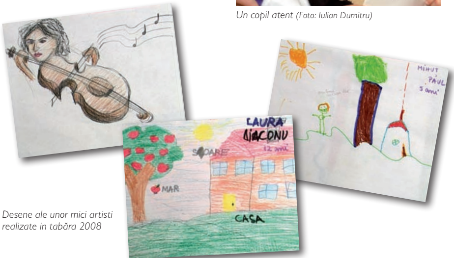
Desene ale unor mici artiști realizate în tabăra 2008