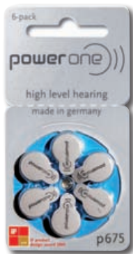
P675 pentru implant cohlear

Produsele se pot livra prin curier în 24 ore oriunde în România.