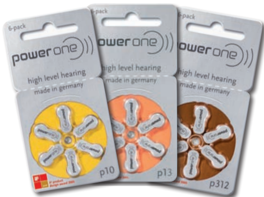
P10, P13 și P312 pentru proteze auditive