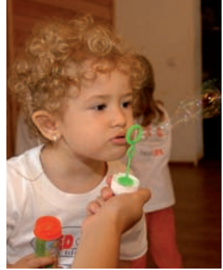
Antrenamentul respiratoriu face parte din logopedie

Specialiștii, veniți din toate colțurile țării, și-au împărtășit experiențele terapeutice și educative, au vorbit deschis despre realizări dar și despre problemele pe care le întâmpină în recuperarea copiilor cu implant cohlear. Chiar dacă opiniile și abordările au fost diferite, fiecare venind cu ceva nou, toți au îmbrățișat ideea că e necesară implementarea unui program național de educație timpurie pentru copiii cu deficiențe de auz. Pentru susținerea acestei idei s-au pus bazele unei colaborări între specialiștii din toată țara în vederea realizării unui proiect care să răspundă acestei necesități.