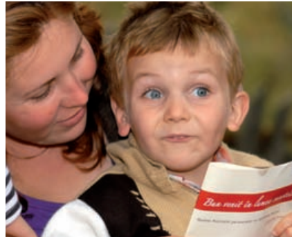
Un copil atent