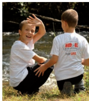
După program: recreație

După cinci zile de activități intense părăsim tabăra, luând cu noi speranța că anul viitor, când ne vom reîntâlni, proiectele începute undeva pe Valea Sadului se vor materializa în beneficiul copiilor, al părinților, dar și al specialiștilor.